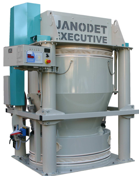
Balance de circuit EXECUTIVE 750+. Benne de pesage 750 litres, portée standard 750 kg, débit : 150 à 200 m 3 /h.