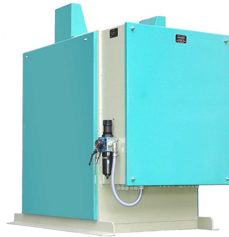
Doseuse pondérale "JANOMATIC-é2" gravitaire.